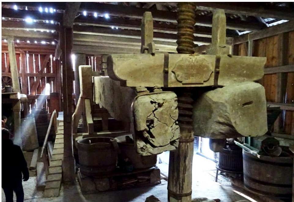
die vorderen beiden Gabeln des «Läderlitorggels» in Weinfeldern

Im Jahre 1790 musste in eine Trotte im Tobel bei Weinfeldern ein neuer Trottenbaum angeschafft werden. Man ersah sich dazu eine grosse schöne Eiche im Schlauch bei Schönenberg. Allein beim Fällen wurde die Gabel zerschlagen, und man konnte sie für den ausersehenen Zweck nicht benutzen.